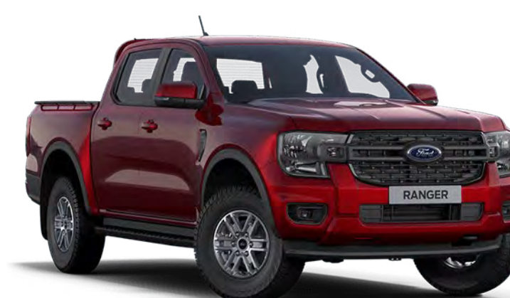
Lucid Red †† Couleur de carrosserie métallisée