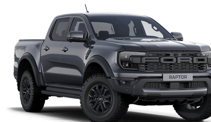
Meteor Grey † Couleur de carrosserie métallisée

Le Ford Ranger est couvert par la garantie Ford corrosion pendant 12 ans à compter de la date de la première immatriculation. Sous réserve des conditions générales.