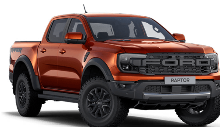
Sedona Orange † Couleur de carrosserie métallisée