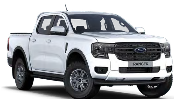
Frozen White †† Couleur de carrosserie non-métallisée