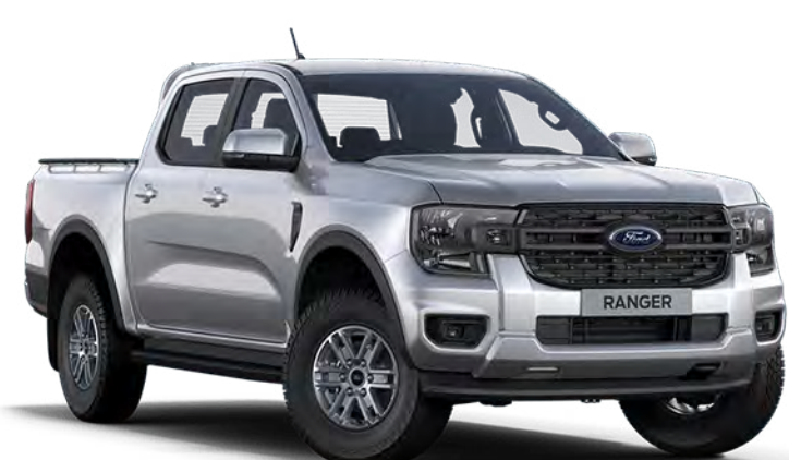
Iconic Silver †† Couleur de carrosserie métallisée