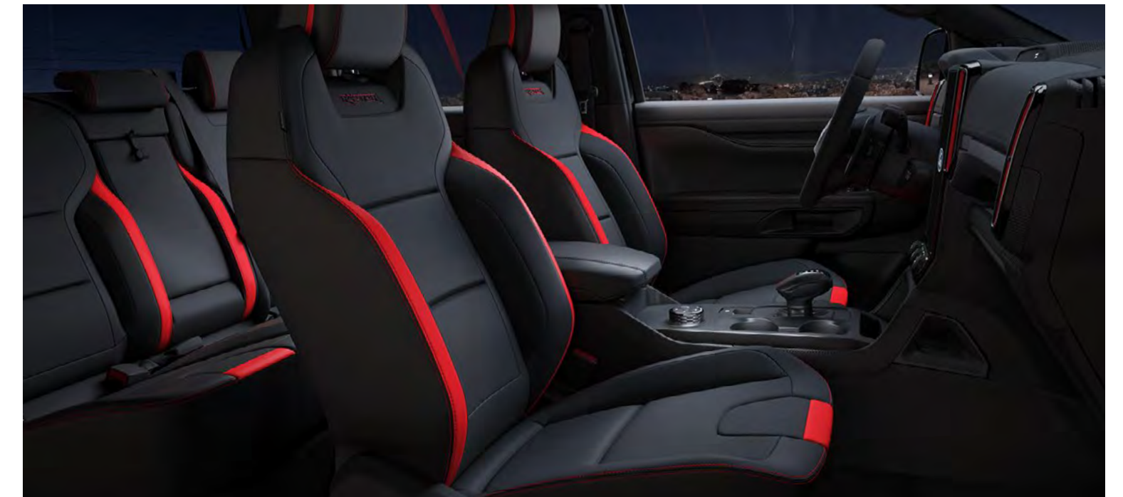
Sensico Super Mat et suédine Dinamica Auto Miko en Ebony (avec accents Code Orange) De série sur Raptor

Remarque Sensico® est une marque européenne de Ford pour les revêtements synthétiques de qualité supérieure développés pour les intérieurs automobiles. Ce revêtement végétalien et durable combine un toucher doux, une qualité supérieure et une superbe finition. Facile à entretenir, facile à nettoyer et protégé contre les taches et les odeurs. Bénéficiant d'une haute qualité visuelle, Sensico® offre non seulement une assise très confortable pendant les longs voyages, mais sa fabrication est compatible avec les valeurs écoresponsables. Sa conception est un gage de tranquillité d'esprit pour les automobilistes modernes et exigeants.