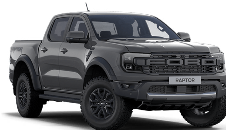
Conquer Grey ††† Couleur de carrosserie non-métallisée