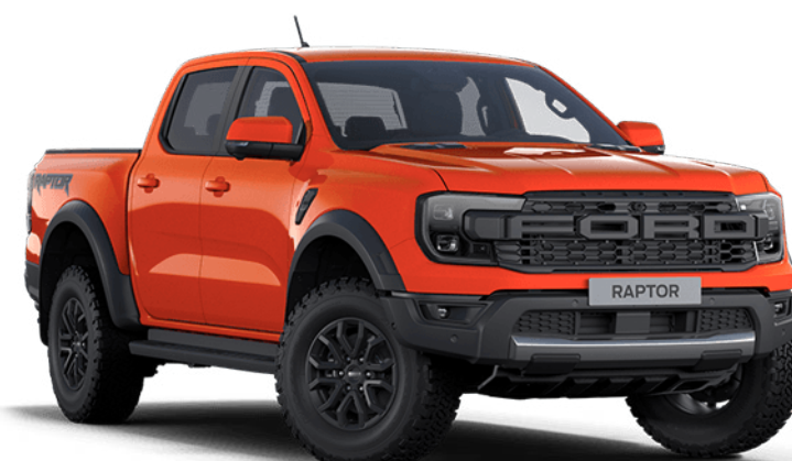
Code Orange † Couleur de carrosserie non-métallisée