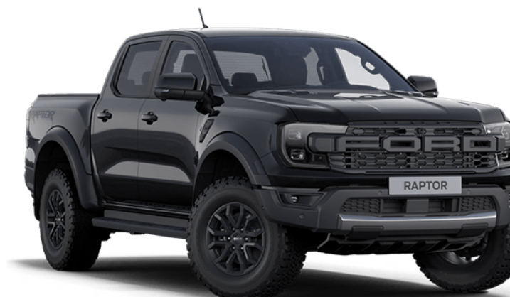
Absolute Black † Couleur de carrosserie métallisée