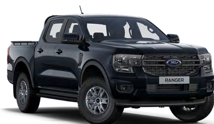
Agate Black †† Couleur de carrosserie métallisée