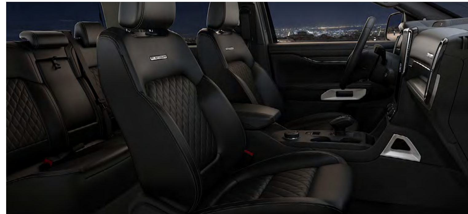
Sellerie Sensico Premium – Edition Grain/Luxury Grain in Ebony De série sur Platinum