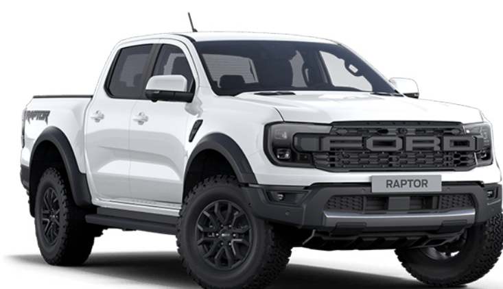
Arctic White † Couleur de carrosserie non-métallisée