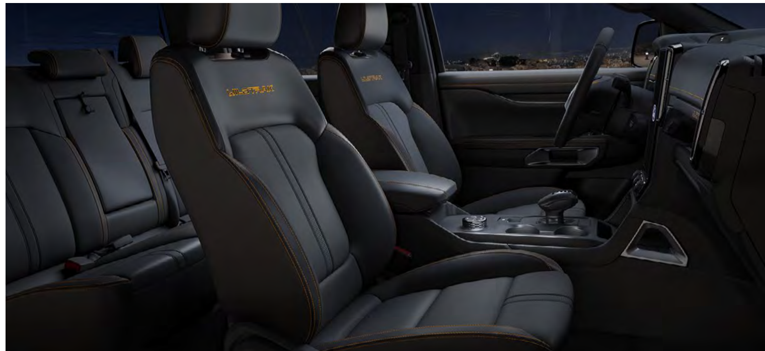
Sellerie Sensico Soho (Microrib en relief) en Ebony De série sur Wildtrak