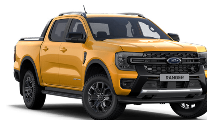
Cyber Orange ## Couleur de carrosserie métallisée spéciale