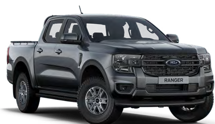
Carbonized Grey †† Couleur de carrosserie métallisée