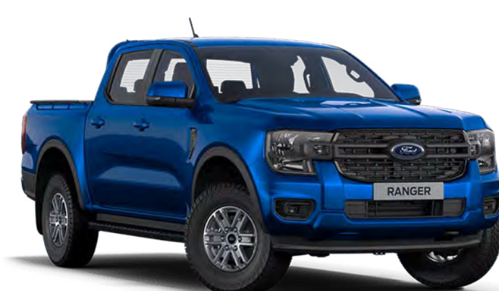
Blue Lightning † Couleur de carrosserie métallisé